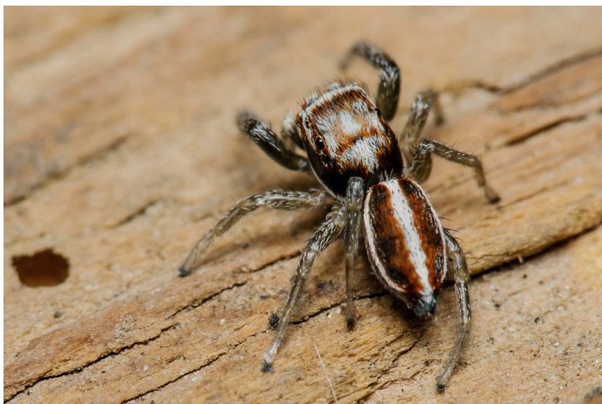
Adultní jedinec, 15.7.2015 v Brno