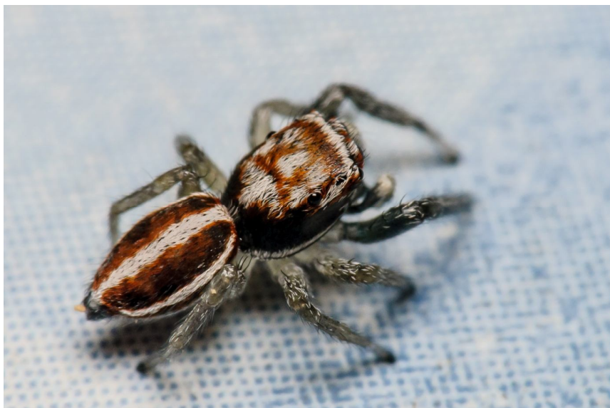
Skákavka Icius subinermis z Brna